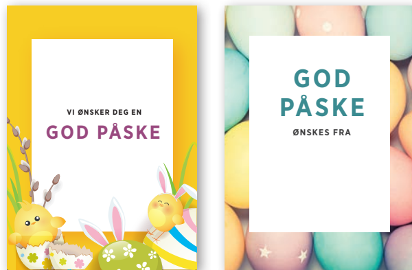
Påskekort design til begge størrelser

Originalarbeid minimum kr 200,-. Startkostnad på kr. 400,- kommer i tillegg.